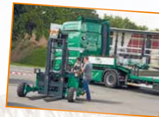
FAHRZEUGE ZUM SELBERFAHREN